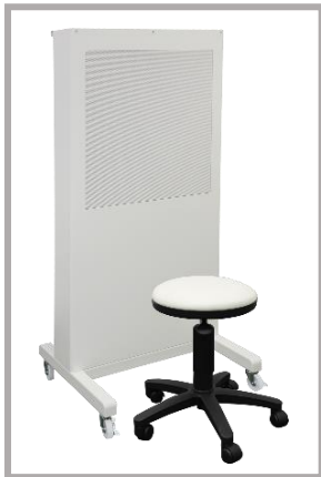
▲ 診察室・待合室に