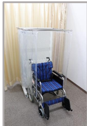
▲ 車椅子の患者様に