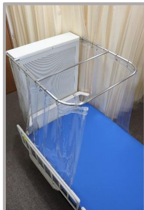
▲ ベッド用簡易ユニットに