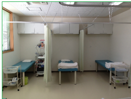
■ リカバリーエリア